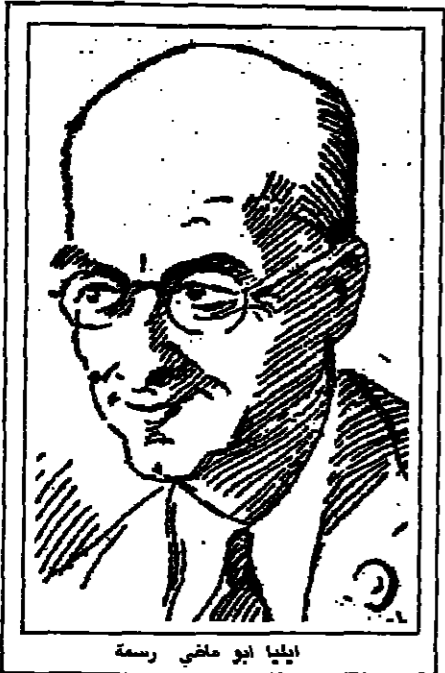
ايلى ابو ماضي رسمة

لم يغب الرجل اللبناني لحظة عن حياة شعراء المهجر الاميري كان له الموقع القريب من القلب. من ردف الذكريات الحميمة. ومن خلال الرجل اللبناني غير الشعراء عن جبههم وفرحهم وحزنهم. وانلقوا. وسخروا. وتناهبوا بالزجل شحا علية. الا من روح الدفعة والظرف والذوق لكن ما قبل علفه النسيان. ولم يصل اليها منه الا القليل القليل. ان من معظم هؤلاء الشعراء. اعلموا جمعه في كتب وطبعه ونشره. وان كل ما نشر لم ينعكس القصيد المعنوية في بعض صفح المهجر.